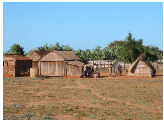
le village d'Ankazomalany

Village de brousse, à 80 kms de Tolagnaro (Fort-Dauphin), cette zone du sud cumule des caractéristiques très particulières : des tribus différentes, une tradition forte avec ses lois et ses coutumes, le culte des ancêtres, un environnement hostile, une région enclavée, un contexte socio-économique et politique difficile, des voies de communication quasi inexistantes, une sécheresse constante qui conditionne la vie de l'Androy. - "Androy, où est-elle la nappe phréatique ? Elle est là, peu importante et saumâtre !" (Extrait d'un chant Antandroy) 1