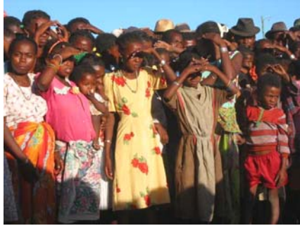
les enfants des villages du Lac Anony

L'école d'Ankazomalany sera inaugurée en Septembre 2002. Le bâtiment, financé par le Comité Local de Développement, comporte 2 classes et recevra 125 élèves en 2 groupes de 60 le matin et 65 l'après-midi.