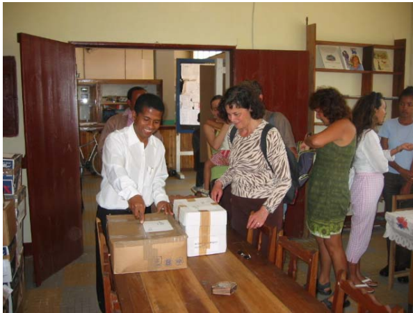
la remise des livres

Après 18 ans, la Bibliothèque Municipale de Fort-Dauphin est prête à rouvrir ses portes. Nous avons été reçus pour la remise officielle des 1845 livres que nous avons expédiés en Septembre dernier. Les Fort-Dauphinois ont été très sensibles à cette opération et comptent sur nous pour le roulement de leur stock. Environ 2000 volumes supplémentaires sont prêts à partir début Octobre avec l'aide de la ville d 'Oissel (Seine-Maritime) jumelée avec celle de Fort-Dauphin.